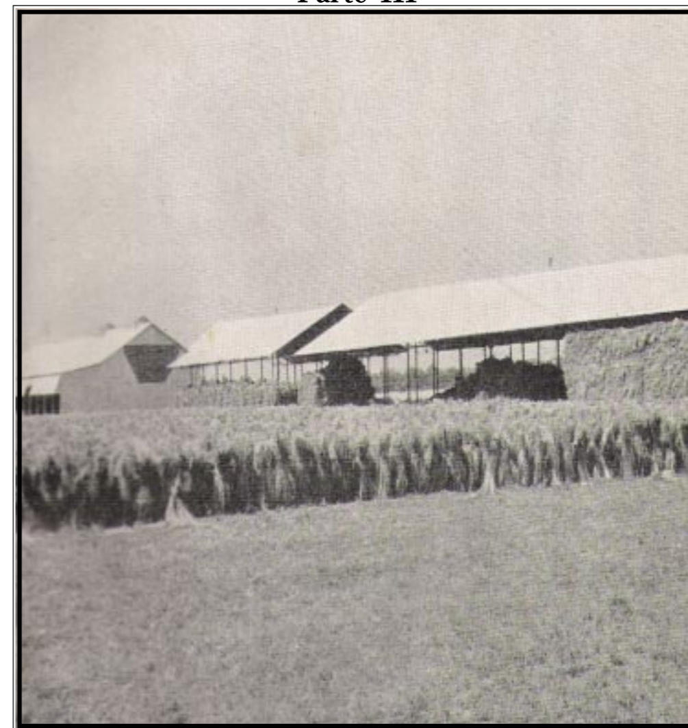
Fotografía de parte del predio de Linera Bonaerense S.A. en el que pueden apreciarse los haces de lino en el proceso de secado luego de ser extraídos de las piletas de enriado (El Telar nro. 163, 1946).