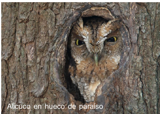
Alicuco en hueco de páraiso

El viernes 27 de junio a las 19 nuestra ONG presentó ante el público lujanense una muestra fotográfica de paisajes y fauna a cargo de Marcelo Morales, y se expuso ante los presentes las diversas actividades del grupo. Dentro de los animales elegidos se mostraron: picaflores, reinamoras, alilicucu e insectos ( m a n t i s ) .